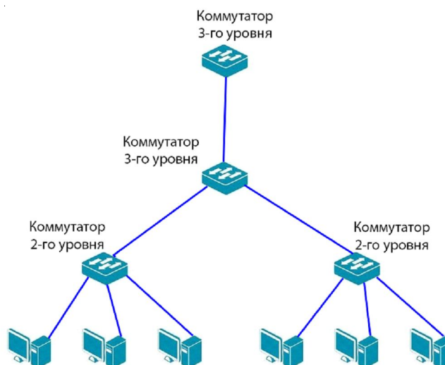
Рис. 3. Схема моделируемой сети