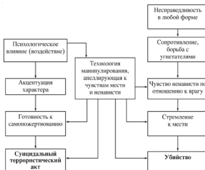
Рис. 2. Схема устранения социальных запретов

Благодаря объединению людей в сообщества определенные информационные воздействия, распространяющиеся через социальные сети, существенно меняют оценку взглядов пользователей. Таким образом, социальная сеть потенциально является ареной информационного противоборства, и возникают вопросы контроля за циркулирующей информацией.